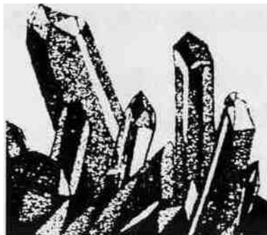
CRISTALLI DI QUARZO

schi di faggio e radure che, nel periodo estivo sono popolate da coloratissime genziane (2) ed orchidee (3). Il percorso aggira sulla sinistra il poggio dei Cristalli (4), così chiamato in seguito al ritrovamento di alcuni cristalli di quarzo e raggiunge in poco più di mezz'ora la fonte del Capitano (5) rinomata per la freschezza delle sue acque.